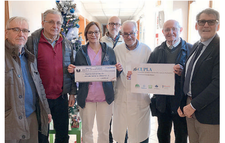
La consegna della cifra raccolta per l'hospice di Borgonovo