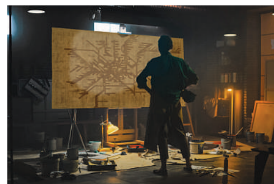
Tappeto Metropolitan gold Dimensioni 170x240 cm / 200x300 cm