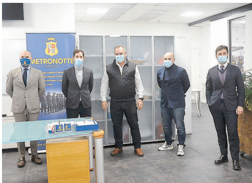
La conferenza stampa di ieri mattina e la sede di Metronotte Piacenza